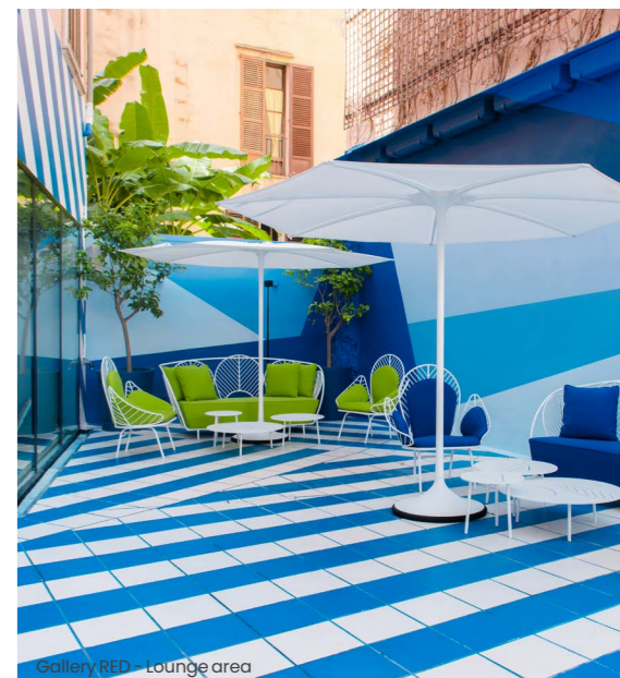
Gallery RED - lounge area